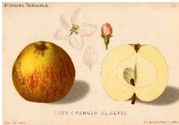
W.Lauche Deutsche Pomologie, 1882/83

MATURITE-CONSOMMATION : Octobre-Janvier.